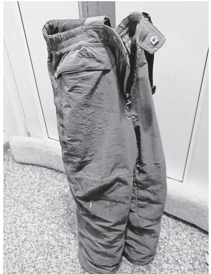
Die magische Hose