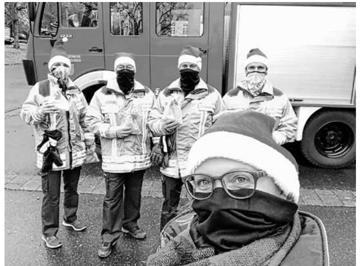
die Helfer des Nikolauses kurz vor dem Start

Jugendfeuerwehr Neckartenzlingen www.jf-neckartenzlingen.de