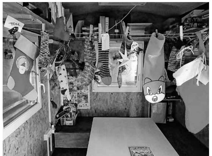
Warten auf den Nikolaus