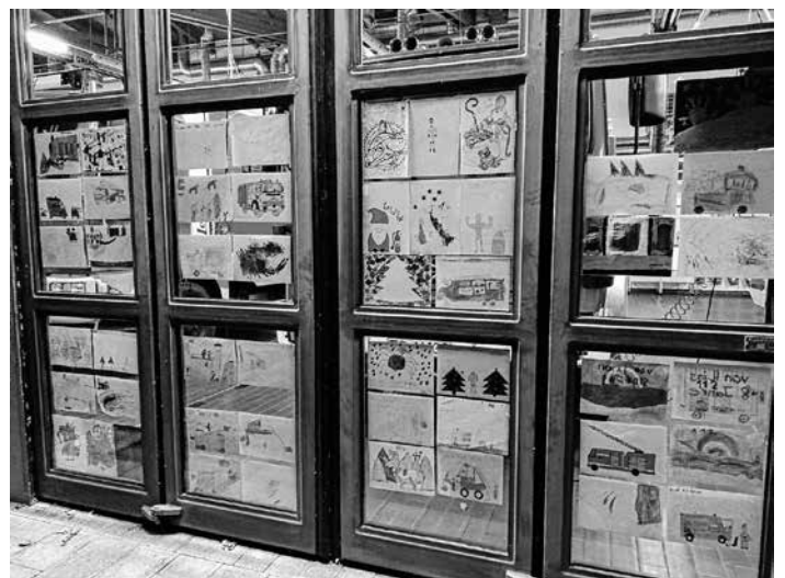
Bilderausstellung am Feuerwehrhaus