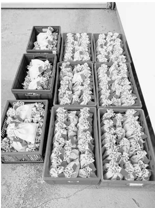
Es kann losgehen...

Montag 17.00 bis 18.30 Uhr Mittwoch 15.00 bis 18.00 Uhr Freitag 10.00 bis 11.30 Uhr Samstag 10.00 bis 11.30 Uhr