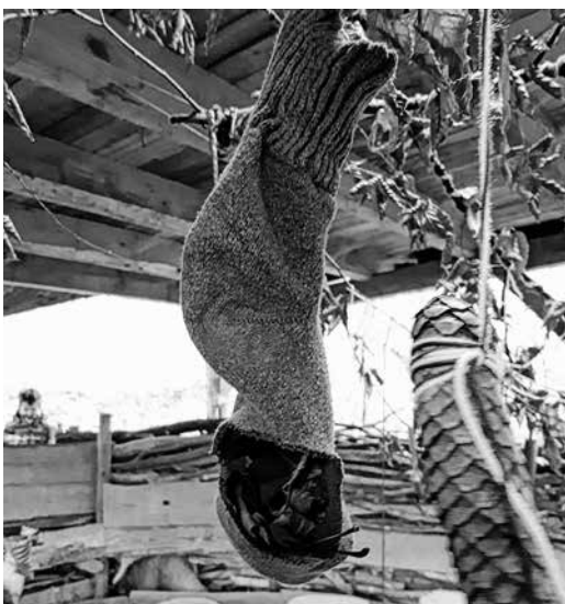
Wer hat denn da an unserem Socken geknabbert?