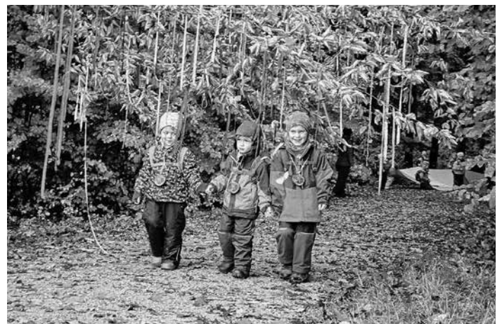
Die neue Eichhörnchen-Generation