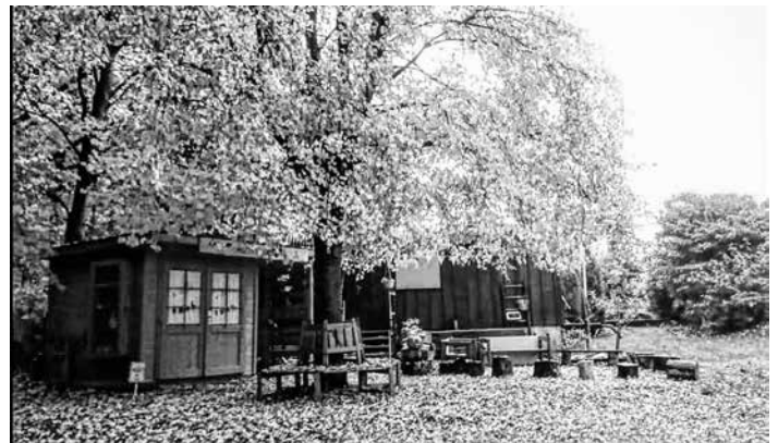
Unser schöner goldener Blätterwald

Mit herb duftenden und raschelnden Grüßen aus dem Wald, euer Eichhörnchen Alexander.