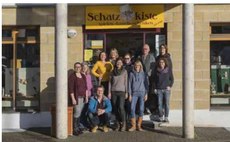
- das Ehrenamts-Team -

* Ein einfaches, modernes Kassensystem und eine qualifizierte Einarbeitung durch unser Ehrenamts-Team machen den Einstieg leicht.