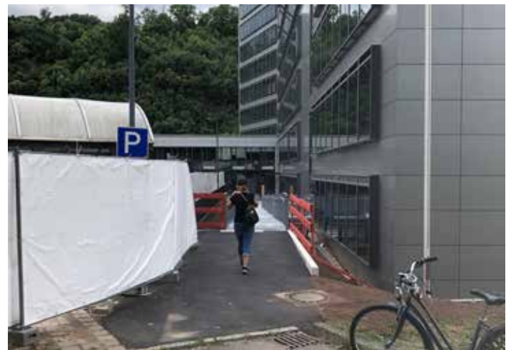
Anlage: 2 Fotos:

Die allgemeinen Öffnungszeiten des Landratsamtes sind Montag bis Freitag von 8 bis 12 Uhr, Montag bis Mittwoch von 13.30 bis 15 Uhr, Donnerstag von 13.30 bis 18 Uhr.