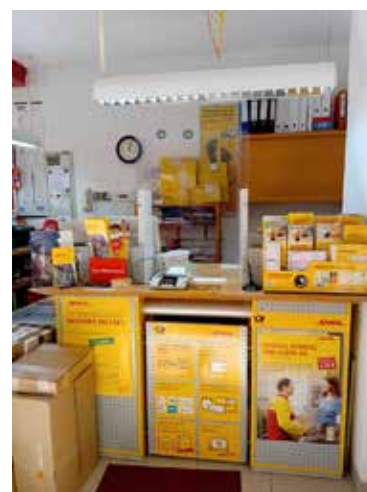
- Postfiliale -