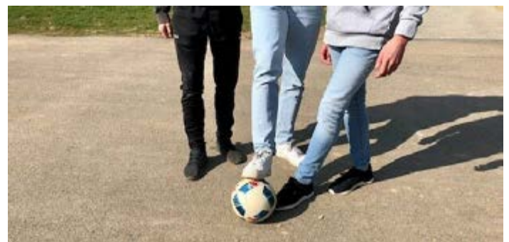
Fußballspielen ist eine beliebte Pausenbeschäftigung