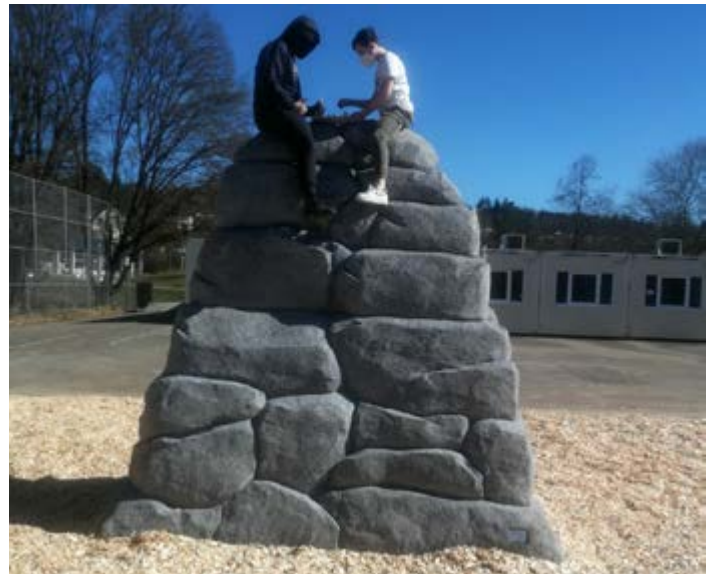
Schach auf dem Kletterfelsen

Die Werkrealschule ist um eine Attraktion reicher: Auf dem Pausengelände wurde ein Kletterfelsen aufgestellt, eingebettet in eine dicke, weiche Mulch-Schicht. Hier können die Schülerinnen und Schüler ihre Geschicklichkeit, ihre Ausdauer und ihren Mut erproben – und auch Schach spielen. Die Freude am „Spiel der Könige“ verbreitet sich gerade in der Werkrealschule. Mehr und mehr Schüler wollen die Regeln erlernen und sitzen in der Mittagspause mit nachdenklicher Miene einander gegenüber. Mancher hat dabei schon vergessen, dass die Mittagspause begonnen hat. Sollte das Interesse anhalten, dann wäre im neuen Schuljahr eine Schach-AG unter der Mitwirkung fachkundiger Mitschüler anzudenken. Mittwochs ist der AG-Nachmittag der Werkrealschule und das Angebot wird immer wieder an die Bedürfnisse der Schüler angepasst. Die Nachfrage nach sportlichen Angeboten ist besonders groß, denn nach dem stundenlangen Sitzen am Vormittag tut Bewegung gut. Im April werden die Container vom Pausenhof entfernt und endlich kann auf dem Hartplatz wieder Fußball, Handball und Basketball gespielt werden.