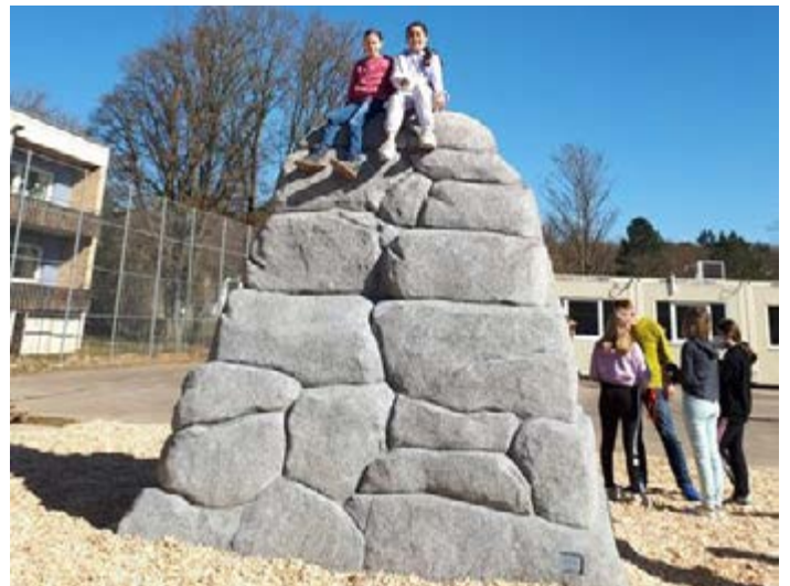
Die neue Attraktion