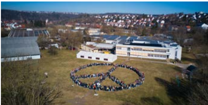
Gemeinsam ein Zeichen setzen