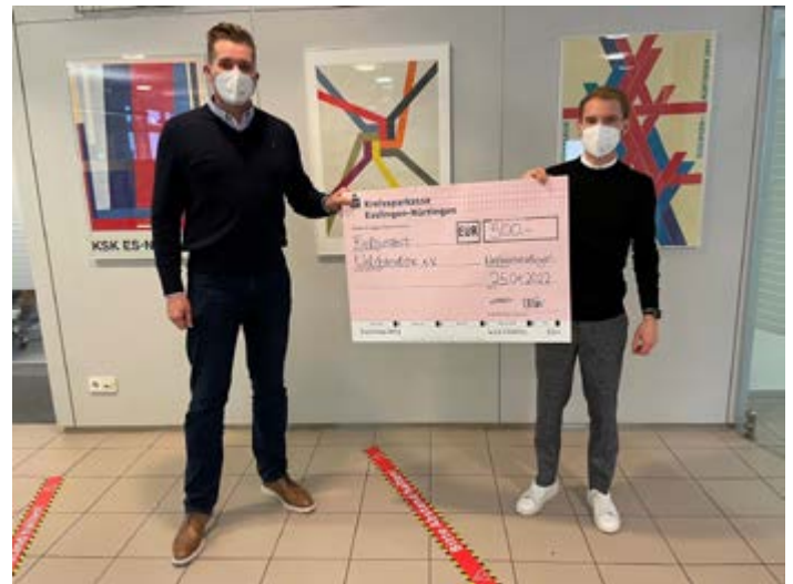
Spenden für die neue Schutzunterkunft. DANKE!

Kontakt: Vereinstelefon: 0152 57613036 Mail an: email@waldstrolche.de www.waldstrolche.de