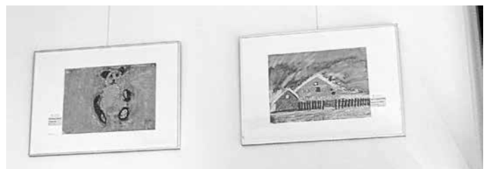
„Teddybär“ und „Landschaft mit Häusern“

Ausstellung des KuBi mit Bildern aus zwei Malkursen