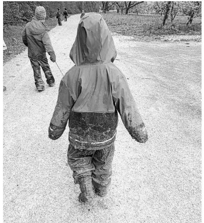
Ein Wald... ähm, Matschstrolch :-)