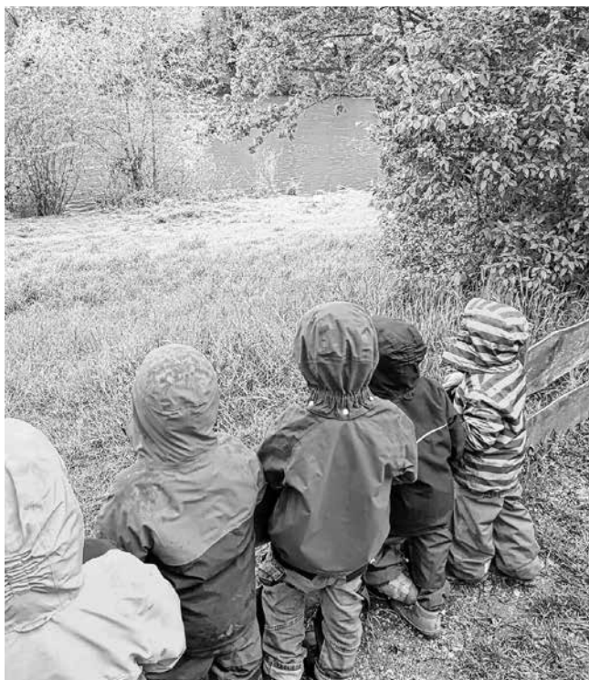
Besuch bei den Schwänenbabys