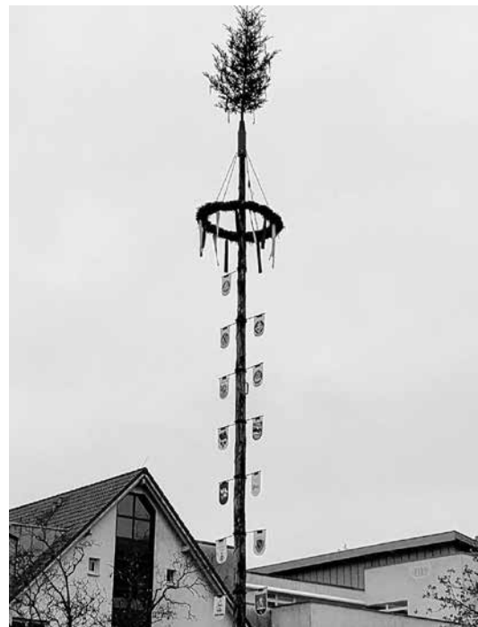
Einem schönen Maibaum kann auch trübes Wetter nichts anhaben!