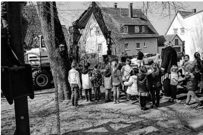
Die Bagger rollen an!

Seit einiger Zeit ist unser Klettergerüst aufgebaut, dass die Kinder als Weihnachtsgeschenk bekommen haben. Die Kinder haben es gleich begeistert angenommen. Endlich haben wir wieder etwas zum klettern, hangeln und balancieren. Vielen Dank auch an den Bauhof, der es uns aufgebaut hat.