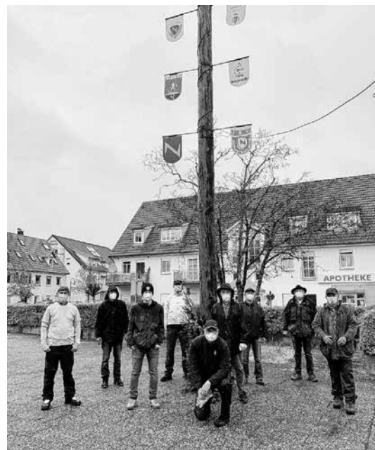
AHA.....die strahlenden, verummten jungen Männer nach dem erfolgreichen Aufstellen des Maibaums!